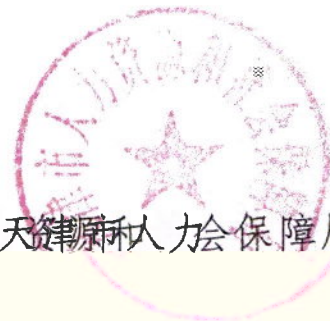
天津市人力资源和社会保障局