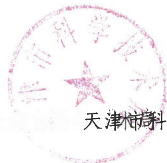
天津市科学技术局