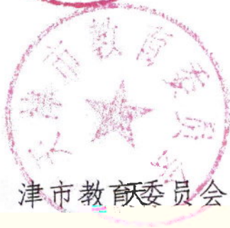
天津市教育委员会